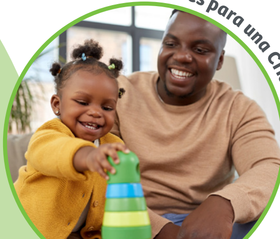
Habilidades para una Crianza Positiva