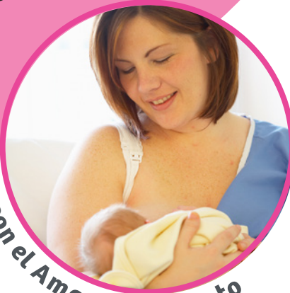
Ayuda con el Amamantamiento