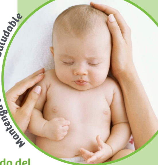
Mantenga a su Bebé Saludable