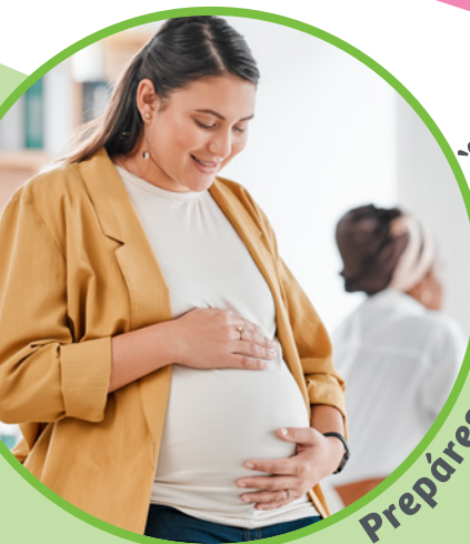
Prepárese para su Bebé